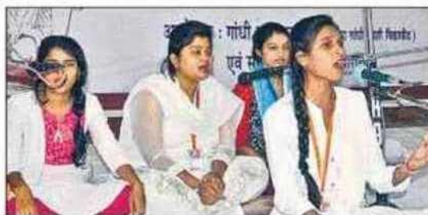
काशी विद्यापीठ के गांधी अध्ययनपीठ में मंगलवार को गांधी सद्भावना यात्रा के स्वागत में गीत प्रस्तुत करती प्रेरणा कला मंच की कलाकार।