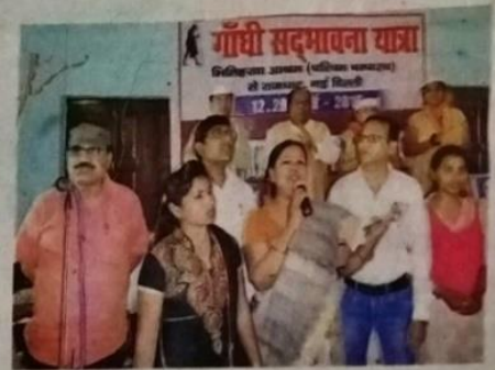
कार्यक्रम में शामिल इटा की टीम एवं अन्य • जगदल