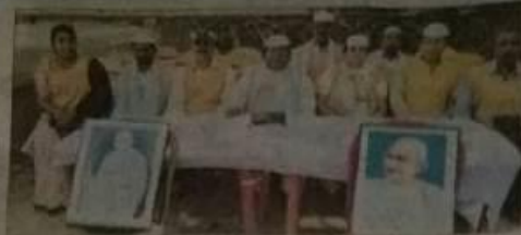
गोष्ठी में शामिल कार्यकर्ता