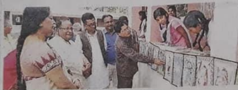
पेंटिंग का अवलोकन करते जिए अध्यक्ष व अतिथि • जागरण

जर्मनी में मधुबनी पेंटिंग की है भारी मांग थरुहट की बेटियां कर रही नाम रोशन