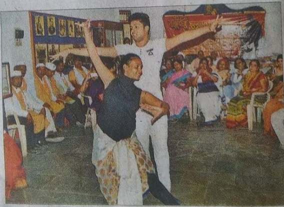
यात्रा के दौरान गांधी संग्रहालय में कार्यक्रम प्रस्तुत करते श्रीलंका के कलाकार.