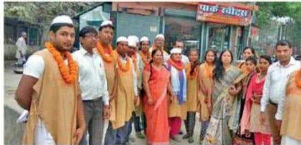
स्वागत में खड़ी कलाकारों की टीम