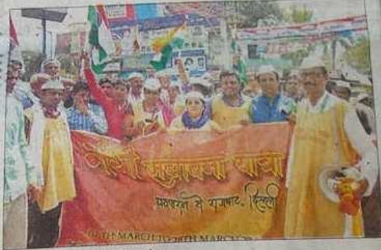
सद्भावना पदयात्रा में शामिल लोग.