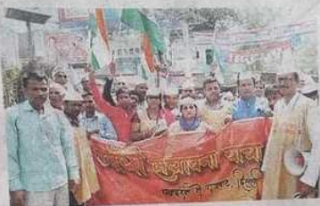
गांधी सद्भावना यात्रा में शामिल किसान प्रतिनिधि

जगदल संवाददाता, छपरा : सत्याग्रह की धरती चंपारण के भिठीहरवा आश्रम से 12 मार्च को प्रारंभ हुए गांधी सद्भावना में शामिल पद यात्री शुक्रवार को छपरा पहुंचे। जहां उनका जेवरदार स्वागत हुआ। शहर के गांधी चौक स्थित गांधी स्मारक पर पद यात्रियों ने माल्यार्पण कर राजेंद्र चौक पहुंचे और डॉ. राजेंद्र प्रसाद के मूर्ति पर माल्यार्पण किया। उसके बाद सभी पदयात्री शहर के चंद्रावती ऑडिटोरियम में पहुंचे जहां किसान सद्भावना समारोह का आयोजन किया गया।