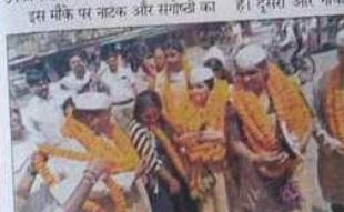
काशी विद्यापीठ में नाटक व संगोष्ठी का आयोजन

वाराणसी (एसएनबी)। राष्ट्रपिता महात्मा गांधी जी के संदेशों को लेकर बिहार के चंपारण से निकली गांधी सद्भावना यात्रा मंगलवार को वात पहुंची। इस यात्रा का गौरव से लेकर जहर, अंतिम तक जगह-जगह स्वागत किया गया। महात्मा गांधी काशी विद्यापीठ के गांधी अध्ययन पीठ सभागार में पहुंचने पर सदस्यों को फूल पाला पहनाकर उनका स्वागत किया गया। इस मौके पर नाटक और संगोष्ठी का