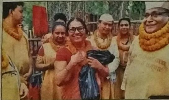
शुक्रवार को बसंतपुर में सद्भावना यात्रा में शामिल सम्मानित सदस्य।

गुरुवार की देर शाम जल्था मुख्यालय के गांधी आश्रम में पहुंचा। सदस्यों की आगवानी के बाद सदस्यों ने आश्रम में स्थित गांधी जी की मूर्ति पर माल्यार्पण किया। रात में सांस्कृतिक कार्यक्रम का भी आयोजन किया गया। श्रीलंका से आए सदस्यों ने अपने कथक नृत्य की प्रस्तुति देकर मौजूद सैकड़ों लोगों को मंत्रमुग्ध कर दिया। कार्यक्रम में वक्ताओं ने महात्मा गांधी