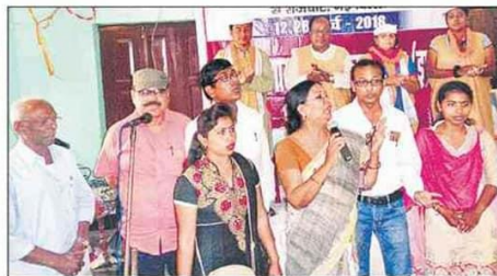
गांधी सद्भावना यात्रा पर पञ्चनख भवन में आयोजित कार्यक्रम में शामिल इटा कलाकार।